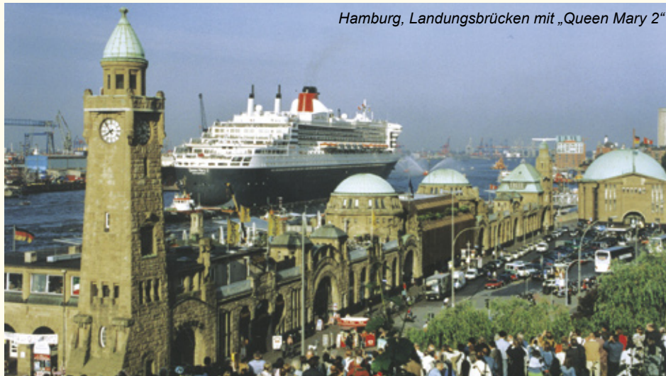
Hamburg, Landungsbrücken mit „Queen Mary 2“

20 Jahre RadelReisen 5 % Jubiläumsrabatt für Direktbucher!